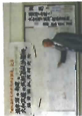
講演の様子 「塩津潟の由来」と「大和政権の發祥地都岐沙羅柵」 ～船内市船内ふれあいセンターにて～ (平成26年6月5日)

光栄にもこのような私のライブラリー「塩津潟のロマン」や「都岐沙羅柵のロマン」の研究に対し平成24年12月、国産産業遺産調査選定から「国際芸術文化博士」を平成25年3月にフランス芸術協会から「日本芸術文化研究博士」を贈りました。