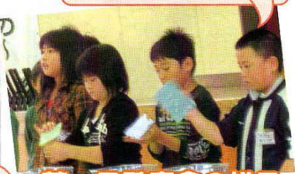
荒っ子発表会の様子