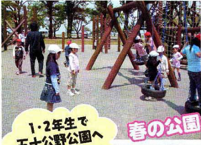
1・2年生で 五十公野公園へ 行きました。

楽しく元気いっぱい活動をしてきた1年生。春と秋の公園へ出かけ、友達と仲良く遊んだり、季節の変化を学習したりしました。栽培活動では、アサガオ・サツマイモの世話を頑張りました。