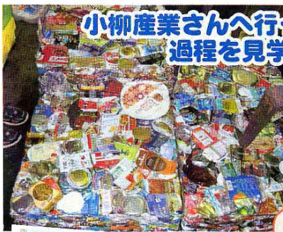
小柳産業さんへ行って、リサイクルされる過程を見学してきました。

「エコ」を考えてきた4年生。再資源化工場へ行ったり、栄養士さんをお招きして教えていただいたりして、自分たちも「エコ」に取り組んできました。