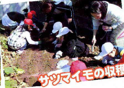
サツマイモの収穫