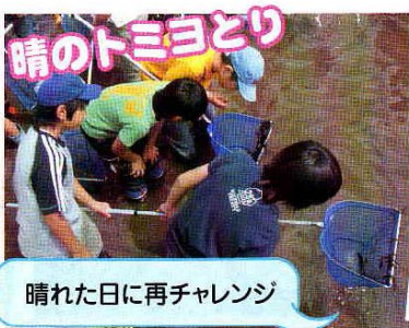
晴れた日に再チャレンジ