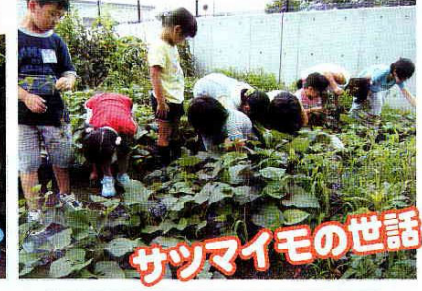
サツマイモの世話