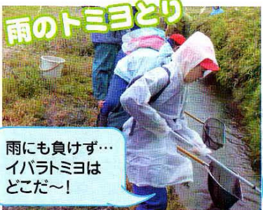
雨にも負けず...イバラトミヨはどこだ~!