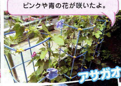
ピンクや青の花が咲いたよ。