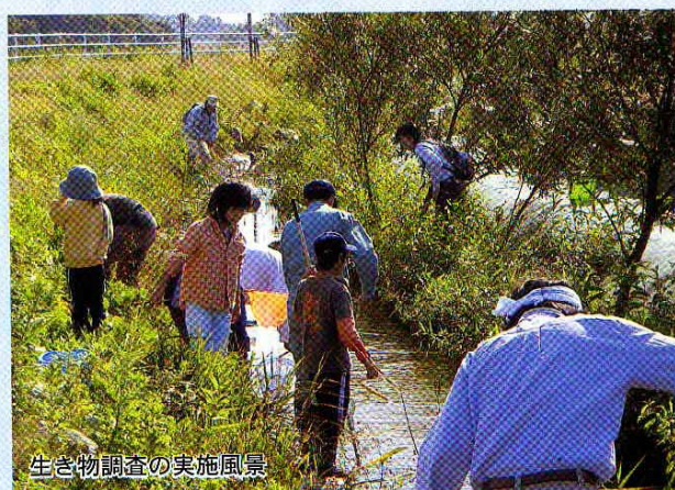
生き物調査の実施風景

当管内の農地整備率は現在約66%程であります。農業の近代化に伴い紫雲寺潟の干拓地に、先人達が造りし農地を、現在の農業経営に即した耕地の大区画化が進んでいます。