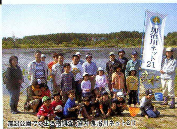
清潟公園での生き物調査(協力 加治川ネット21)