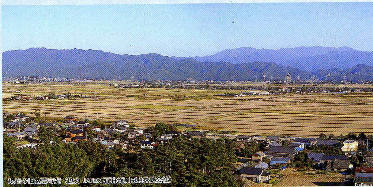
現在の旧紫雲寺潟