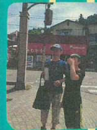
いつでもどこへでも 旅行先にも水筒を 持っていきます。