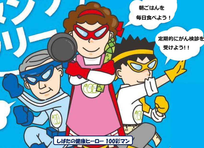
しばたの健康ヒーロー 100彩マン