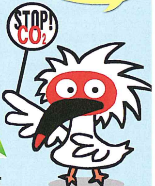
新潟市地球温暖化防止キャラクター 「とめドキくん」 [Character design: Ga2Ga4]

来場者に記念品を 配布するブースもあるよ♪ みんな、マイバッグを 持ってきてね!