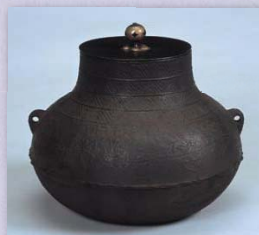
「古芦屋松竹梅地紋釜 金宗泰和所持 箱書菱々斎 狩野光信下絵」 鹿苑寺蔵