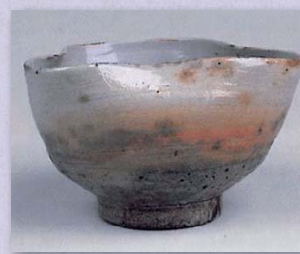
「金海掬手茶碗 銘藤波 千家名物・藤田家旧蔵」 鹿苑寺蔵