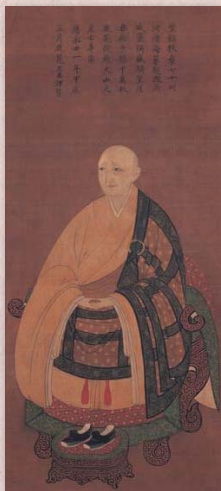
「足利義満像 藏中庵重持」 相国寺蔵