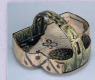
「織部川浜形手鉢」 鹿苑寺蔵