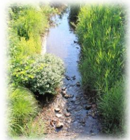
魚採り会場: 荒川川