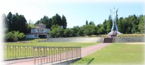
園内でトレッキングを楽しむこともできます

月岡温泉カリオンパーク駐車場右側の建物 レストラン花里(はなさと)の入り口が休憩室を兼ねています = 講習会・アクアリウム会場