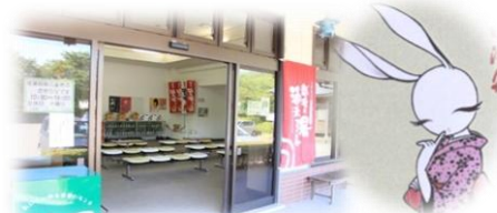
徒歩3分で月岡温泉 無料の足湯もあります