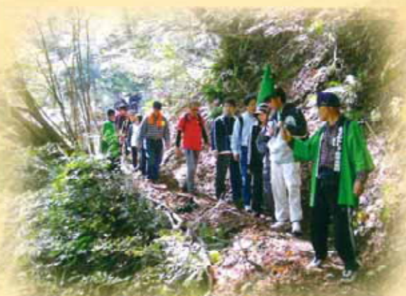
昨年のウォーキング