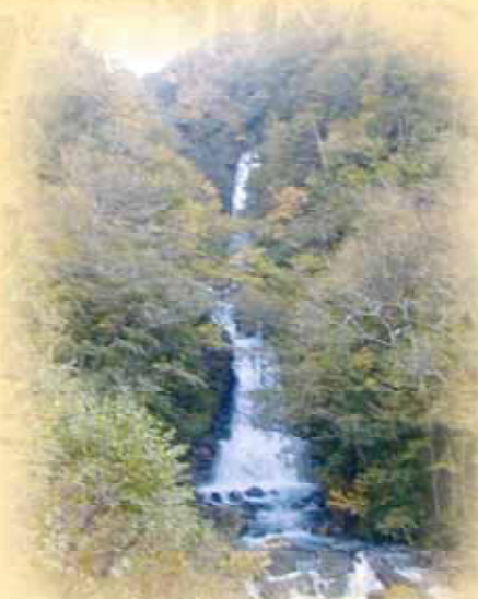
日暮しの滝(松川街道)