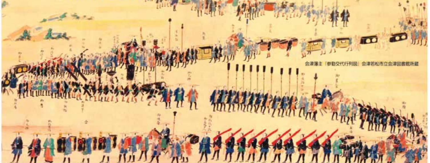
会津藩主（参勤交代行列図）会津若松市立会津図書館所蔵

後援：福島県・会津若松市・喜多方市・下郷町・桧枝岐村・只見町・南会津町・北塩原村・西会津町・磐梯町・ 猪苗代町・会津坂下町・湯川村・柳津町・三島町・金山町・昭和村・会津美里町・ NPO法人全国街道交流会議・あおりかいどう会議・みやぎ街道交流会・くりはら街道会議・ 三宿地域連携協議会・出羽の古道六十里越街道会議・越後米沢街道十三峠交流会・羽州街道交流会・ NPO法人東北みち会議・会津まほろば街道推進協議会・ 日本風景街道（城下町あいづ道草街道、桑折宿まちなか街道）・福島民報社・福島民友新聞社・福島テレビ・ 福島中央テレビ・福島放送・テレビユー福島