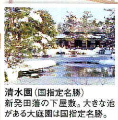
清水園(国指定名勝) 新発田藩の下屋敷。大きな池がある大庭園は国指定名勝。