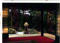
石泉荘(登録有形文化財) 新発田川が静かに流れる、雪の庭園が鑑賞できます。