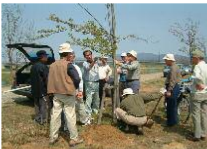
加治川堤の桜の調査も活動事例として紹介しました。