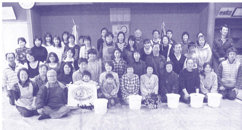
手前味噌の仕込みを喜ぶ参加者たち

味噌は、使う塩の種類で味が変わる（？）、それが手前味噌づくりの楽しみでもあります。そのため、味噌づくりを始めて10年になる当会会員の一人は、毎年いろいろな天然塩を使っています。しかし、どの塩が一番おいしい味噌となったかについては、未だに分からずじまいだそうです。誰でもできる味噌づくり、されど味噌づくり。奥が深いです。