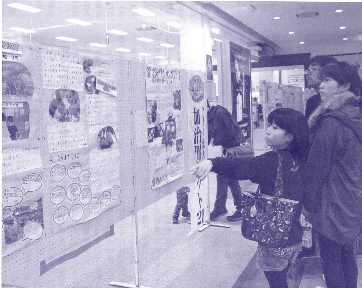
「へえ、なるほど。子供たちってよく周りのことを見ているのね。」

小学生たちから学ぶ 私たちの身近な環境 加治川ネット21が主催する平成24年度の「小学生による環境学習パネル展」が11月、イオンモール新発田店で開催されました。 子供たちにもっと身近な環境に目を向けてほしいとの思いから、当会では小学校の環境学習支援にも力を入れていますが、その一つがこのパネル展です。子供たちの学習成果を、より多くの人に見てもらい、感じてもらうことがねらいです。 平成19年から始めたパネル展も今回が6回目。新発田市、聖籠町の小学校22校から出展がありました。 ひとくちに「環境」といっても、切り口はさまざま。ごみに始まり、地域の川や池の水質、生き物調査、給食の食べ残しのリサイクル、お茶や米の栽培を通しての気付き、地域の自然を守るためにできること、野鳥観察など、それぞれ時間をかけて調べた成果が、大きな紙にびっしりと表現されていました。 パネル展は今年も開催予定です。今回見逃した方、ぜひ次の機会に小学生の「力」を感じてください。