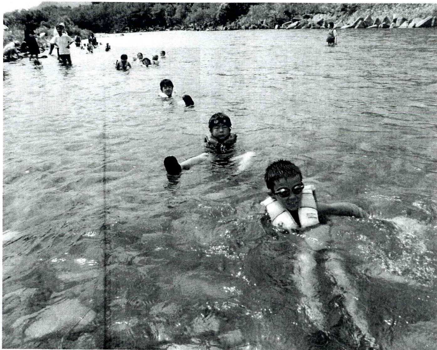
加治川は子供たちの歓声でいっぱい

「川は危ない場所」「川には近づかないように」。そんなことがいわれるようになったのはいつ頃からでしょうか。その昔、夏の遊びの代表は川遊びでした。しかし、近年、子供たちが川で遊ぶ姿はあまり見られなくなりました。そこで加治川ネット21が毎年実施しているのが、清流加治川で思う存分楽しんでもらう「水辺の大楽校」です。 写真は今年八月に車野小学校近くの加治川で実施した水辺の大楽校の様子です。加治川には市が指定した水泳場が二カ所あります。しかし、それ以外の場所でも大人がついて遊び方を教えてあげれば、安全に遊べる場所は沢山あります。これもそんな場所の一つです。 今回の水辺の大楽校には、福島県南相馬市から新発田市に避難している二家族も参加し、川の生物観察、ライフジャケットを着用した川下りや対岸でのカブトムシ探しに歓声を上げていました。震災以前から、南相馬市では川で泳ぐということではなく、水泳はプールが定番。自然の中で川と親しむ今回の体験は、新しいふるさと「新発田市」の思い出の一ページになったようです。