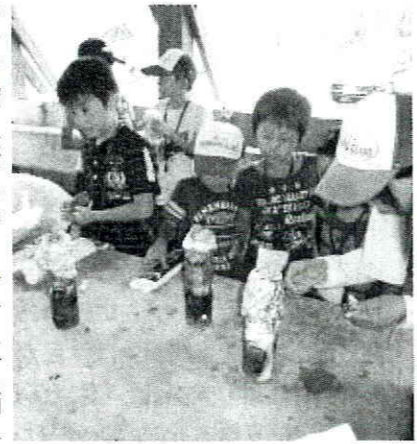
空き缶で「サバメシ」に挑戦

7月31日(日)、イオンチアーズクラブが、今年も当会の企画運営で「水辺の大楽校」を開催し、下越地区内から5店舗の総勢60名の子どもたちが参加しました。会場は滝谷森林公園です。