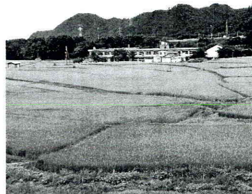
心安らく田園風景