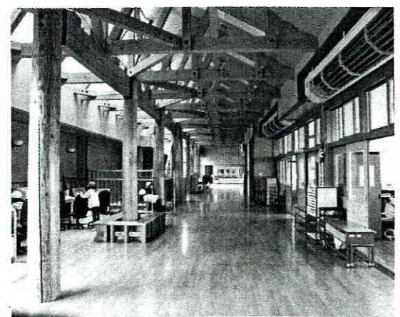
木の温もりが優しい木造校舎

大気中の放射性物質が、そのときの気象条件や地形の影響を受けて滞留したものと考えられ、放射線測定の方法や測る人の熟練度によっても数値は大きく変化します。