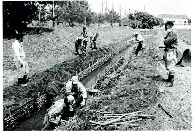
昨年引き続き実施した護岸工事

「レッドデータブックにいがた」に「新発田市の生息地は消滅した」と紹介されていたイバラトミヨですが、2002年に新発田市六日町の天辻川で再発見され、さらに隣接する太崎、久保地域でも生息が確認されました。特に久保地区の清水川は湧水が豊富な土水路が残されていることから、イバラトミヨをはじめ、トノサマガエルやホトケドジョウなど、絶滅が心配される生物が豊富です。