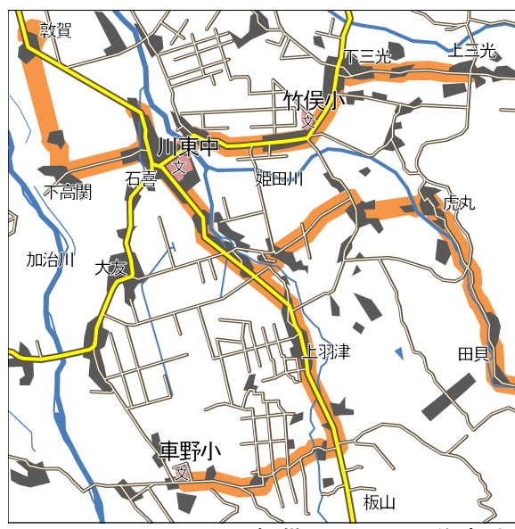
■ 提供エリア ■ 住宅地 図1 提供エリア