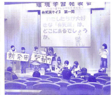
地域紹介をクイズ形式で

当会が主催する大事業、新発田町・聖籠町小学生による「環境学習発表会&ポスター展」が、平成21年11月