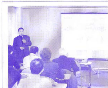
NPO法人 加治川ネット21団体紹介(順不同)

桶を再生させる「たが屋」、古い鍋などを修理する「いかけ屋」、頼戸物の「焼接ぎ屋」、かさの古骨買い「かき」、現代ではほとんど耳にすることがなくなった職人技が、江戸時代の暮らし、物を大切にすることを支えていたこと、現代に生きる私たちが次世代に伝えるべきはなんなのかな、こんな身近にはたくさんあることを改めて感じさせられた講演でした。