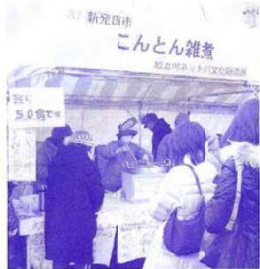
具たくさんで安心、おいしいよ。

1月10日午前10時、加治川ネット21が構想3年の末、総力を傾けて作り上げた「こんとん雑煮」を携えて参戦した雑煮合戦の開幕です。