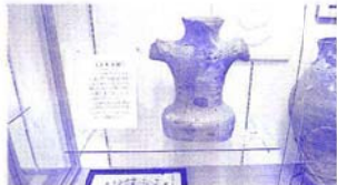
加治川展示室にあるヒト型土器

高さ45・3cmでS字状の左右対称の文様があり、頭部の形が略されています。このような胴体だけのヒト型土器は全国的にも珍しいもので、新潟県の有形指定文化財に指定されています。