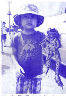
ほーら、見て見てこのカエル

夏休み最後となる日曜日、8月29日に加治川に近い向中条地区で「農地水・向中条地域保全会」の生き物観察会が開催されました。この地区の観察会が当会が講師を務めるのは今年で4年目になります。当日は13名ほどの親子連れの参加がありました。