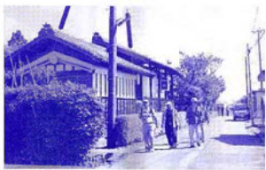
会津街道、丑首地区を行く

えてくれま す。川のある 風景は、歩いて みてそのよ さが分かって きます。そして、 効率性を 求めない川 ほど景観的 にもやさしく美 しく感じられ