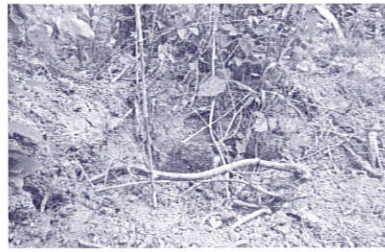
クズの根があちらこちら掘り起こされて

実際に現地では電気柵やサル捕獲用の檻を見ると、猿害に悩まされる農家の苦勞が垣間見られます。しかし、鳥獣害の対象はサルだけではなくありません。今回電気柵の状況も見学しましたが、張り巡らされた電気柵の外側には、イノシシの足跡やクズの根を掘り起こした跡がいくつも確認されました。