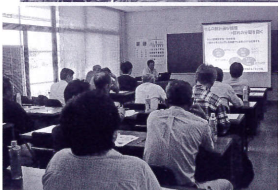
現地調査前に鳥獣害の説明を受けて