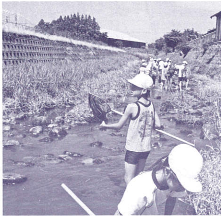
何かいるかな？ 網を入れてガサガサ

今回の生き物調査に先立ち、一週間前に大きめのペットボトルで各班2個ずつ魚捕獲器を作成し、それを前日に橋のたもとから下流に仕掛けました。当日は、最初に班の代表者に川の水