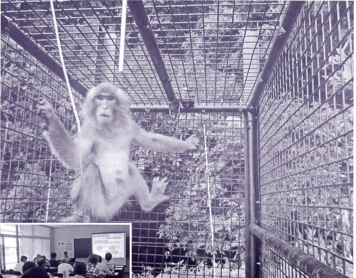
檻に捕獲された猿。発信機をつけて行動を調査