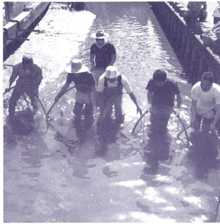
大人たちが追い込む網の先に鯉の姿が

今年7月に、「ハードオフコーポレーション」が「トキの森クレジット」を購入したことが報道されていましたが、これも「カーボン・オフセット」です。