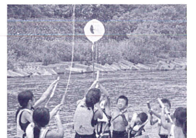
人気の手作り水鉄砲で遊ぶ子どもたち

変わり炎天下の中での川遊びがメイン。待望の加治川での活動で、子供たちは皆いきいき。川にさえ入ってれば、