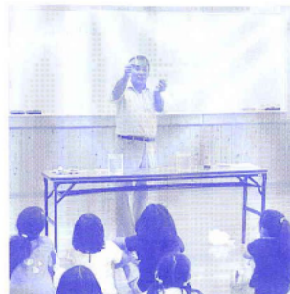
水質はどうか(加治川小学校)

実験の一つ、生活排水での水の汚れの観察では、きれいな水道水1ℓに醤油を目標一滴ほどの量を入れてCODを測定しました。きれいだった水道水が一気に8以上という汚れた水の数値を示したことで、児童たちは微量の汚れでも水質が大きく変わることを知ったようです。