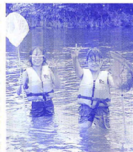
ライフジャケットを着て魚取り

冷たく感じられたものの、川の流れに身を任せたり、水中生物を探したりと、川遊びを満喫していました。 水辺の大乗校のメニューに欠かさない竹を使った水鉄砲作りや、ストーンアートの化石作りは今年も好評で、より飛距離のなる水鉄砲を作るためにどうすればいいかを学んだり、より化石っぽく見える石の選び方や絵の描き方を教えてもらったりと、陸に上がった河童たちは、それぞれの活動を楽しんでいました。