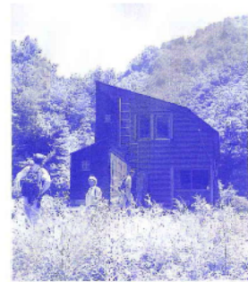
山荘も新しくなり湯の平への道も朝日

平成15年に林道で落石があり、それ以降、加治川治水ダムから先は通行止めとなっていました。新発田市が落石対策工事を行った結果、今年10月からは徒歩限定ではあるものの治水ダムから先の通行ができるようになり、温泉にもいけるようになりました。新発田の秘湯を味わってはいかがですか。