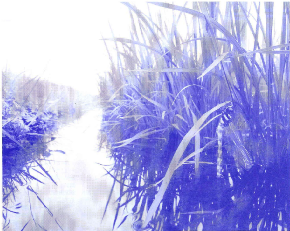
上三光の特別栽培米のほ場に

映画「三丁目の夕日」は、多くの人の心を温かく包み込みました。こういう温かな気持ちには、どこから湧いてくるのでしょうか。 それは、おそらく、人が自然を持ってしてもかかわらない、自然と人が生み出しているものの中にあるのでしよう。私たちは、長い月日をかけて自然を利用し、多くの文化を創ってきました。川は自然と人が創り出したものともダイナミックな文化でありアートです。そこに生けるものが集い、命を育んできました。 自然の豊かな場所には匂いがあります。その土地の匂いもします。生物的なことは知らないまでも、そこでの存在が調和のとれたものとしてあるとき、風景は人に温もりを与えてくれます。しかも、そういう美しい風景も少なくなっています。 幸いなことに、下水道の普及や、化学肥料、農薬の低減で、一時的になくなった生物たちが田んぼに甦ってきました。田んぼは先人の造った偉大な文化のひとつですが、生き物がいてこそ成り立つ文化でもあります。